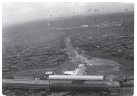
1961（昭和36）年12月に開業したハイランド駅と富士五湖国際スケートセンター

さわしい国際観光ホテルの誕生だった。また、この年の12月には日本初の人工スキー場を籠坂峠に開業、さらに富士山南麓の十里木を中心とする広大なレジャー基地「日本ランド（現・ぐりんぱ）」や海洋レジャー基地「初島」など各エリアの観光開発に積極的に取り組んでいった。