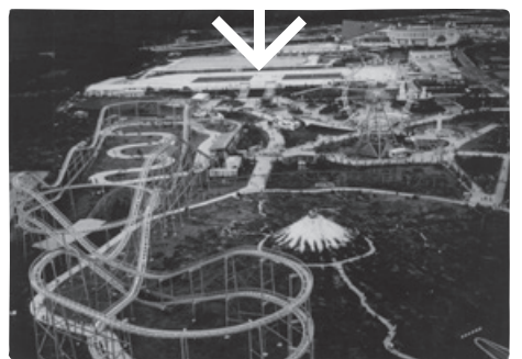
1969（昭和44）年3月、グランドオープンを迎えた「富士急ハイランド」