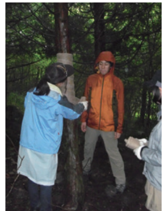
上：2013（平成25）年には富士山世界文化遺産登録祝賀として清掃登山を実施 下：「富士急記念の森林」で森林整備を行う社員たち

富士清掃登山も、富士山への感謝の意を込め、1964（昭和39）年に第1回を実施し、1976（昭和51）年に創立50周年事業の一つとして第3回目を実施して以降、5年ごとに周年事業の一環として行っている。創立75周年を迎えた2001（平成13）年には、NPO富士山クラブによる「富士山浄化プロジェクト」に約400人の社員が参加。富士宮口山頂に設置されたバイオトイレの稼働に必要な杉チップや水を運搬した。