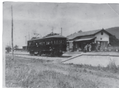
大月―富士吉田間を電化、開業を迎えた富士山麓電気鉄道。東桂駅にて（1929〈昭和4〉年6月）

た富士山麓電気鉄道は、各方面への鉄道路線の延伸をやむなく断念する。代わりに、設立の翌年から営業していたバス事業の強化に取り組み、自社交通網の整備と営業網の拡大を進めた。