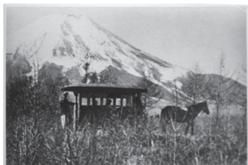
富士山麓の梨ヶ原（現・自衛隊北富士演習場内）をゆく富士馬車鉄道（1925〈大正14〉年）

さらに、1950（昭和25）年8月には、富士吉田―河口湖間3・0kmに新路線（現・河口湖線）を開業、大月―河口湖間