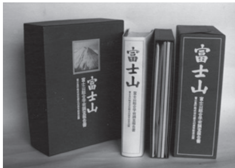
1971（昭和46）年9月、創立45周年記念事業として刊行した「富士山総合学術調査報告書『富士山』」

一方、「富士山」をめぐる学術の分野でも、富士急行は大きな足跡を残してきた。その一つに、創立45周年記念事業として1971（昭和46）年9月に刊行し