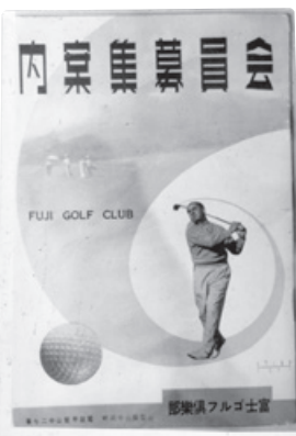
会員募集のパンフレット。富士ゴルフ場（現・富士ゴルフコース）は1935（昭和10）年8月に開業した