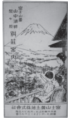
別荘案内のパンフレット。山中湖畔の別荘地造成は1927（昭和2）年より開始された