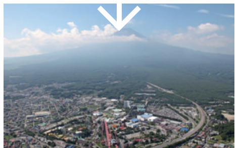
富士五湖国際スケートセンターの開業から50年、アミューズメントパークとして進化を続ける富士急ハイランド（2012（平成24）年）