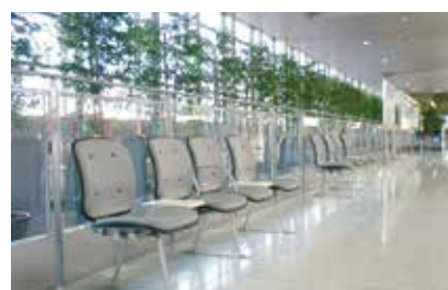
切符・磁気カードをリサイクルして製作したベンチ

線路脇の斜面や駅施設に植栽する緑化活動や、社員によるクリーン活動、里山の保全活動などの社会活動を行っています。