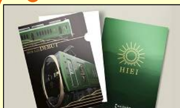
キラ鉄ファイル（税込 400 円）