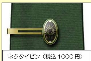
ネクタイピン（税込 1000 円）