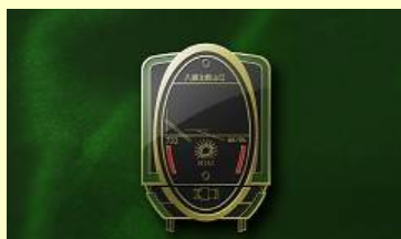
ピンバッジ（税込 400 円）