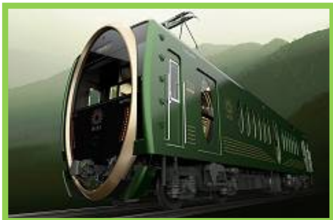
※叡山電車のホームページより転載。

(ケロちゃん) コロちゃんに、「ひえい」の魅力をひとことで紹介してもらおうケロ！…はい、どうぞ。